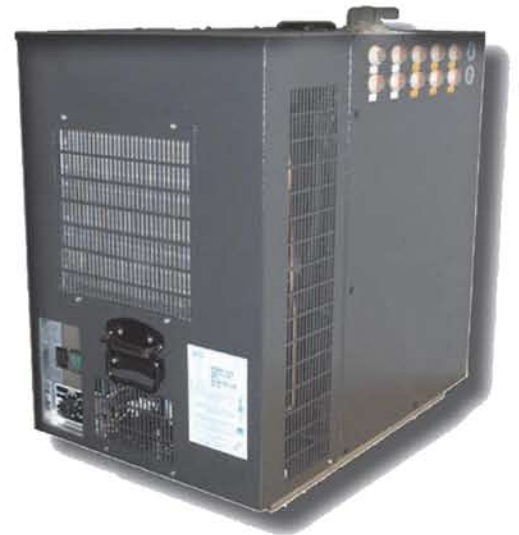
MIX ACCIAIO 3/8 HP STEEL MIX 3/8 HP